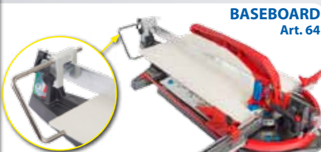
BASEBOARD Art. 64