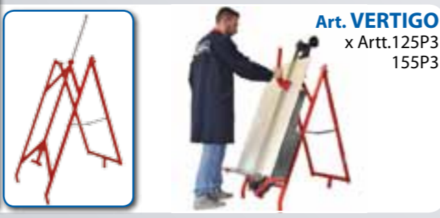
Art. VERTIGO x Artt.125P3 155P3

GARANZIA - Tutte le tagliapiastrelle manuali MONTOLIT sono coperte da garanzia a vita (riconosciuta a giudizio esclusivo dell'Ufficio Tecnico della Brevetti MONTOLIT S.p.A.) su eventuali difetti di costruzione. Guasti derivanti da un uso non conforme o da normale usura sono esclusi dalla presente garanzia.