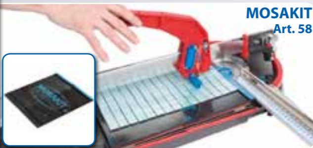
MOSAKIT Art. 58