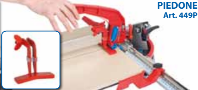
PIEDONE Art. 449P

ACCESSORI • ACCESSORIES • ACCESSORI • ACCESSORIES • ACCESSORI • ACCESSORIES • ACCESSORI • ACCESSORIES • ACCESSORI • ACCESSORIES